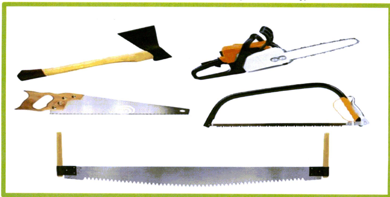
Изображение № 8 Разрешенные инструменты для заготовки

При заготовке валежника допускается применение ручного инструмента (ручных пил, топоров, бензопил) ( смотри изображение 8 ).