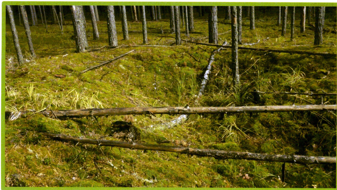
Изображение № 1 Валежник

Примеры валежника (смотри изображения №№ 1,2,3).